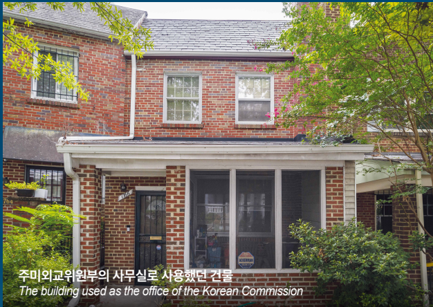
주미외교위원회의 사무실로 사용했던 건물 The building used as the office of the Korean Commission

이곳은 1941년 4월 해외한국대회에 통해 설립된 대한민국 임시정부 공식 대미 외교기관의 첫 번째 사무소였다. 주미외교위원회는 미주 한인 단체들을 결집해 미국 정부와 정계를 대상으로 임시정부 승인과 군사 지원을 이끌어내기 위한 활발한 외교 활동을 전개하였다. 특히 1939년 11월부터 사용된 이 호바트가 사무실은 이승만이 일제의 미국 침공을 예견한 저서 『Japan Inside Out』이 집필된 장소로, 이를 계기로 워싱턴 외교가의 주목을 이끌어 낸다. 이후 외교 활동이 점차 확대됨에 따라 1944년 4월 인근의 두 번째 건물(4700 16th St. NW)로 이전하여 1956년까지 주요 외교 거점으로 활용하였다.