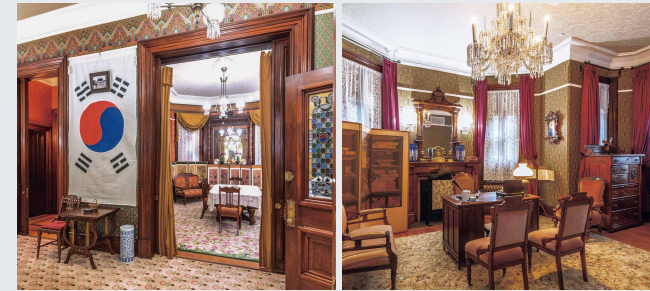
전시실 Exhibition Halls

공사관은 각 층별로 공간의 성격이 명확히 구분된다. 1층은 고종의 어진을 모시고 망궐례를 올리던 정당, 외빈 접견을 위한 객당, 연회 공간인 식당으로 구성된 가장 공적인 공간이다. 2층은 외부인 출입이 제한된 공사 집무실과 공관원 사무공간, 서재 등이 위치한 사적인 집무 공간에 해당한다. 과거 숙소로 쓰였던 3층은 1943년 이후 변형되어 홀로 사용되다가, 현재는 한미우호의 역사를 알리는 전시실로 새롭게 조성되었다. 건물 외부는 현관의 포치와 옥상의 국기 게양대를 복원하였으며, 별도의 한국 전통 정원을 마련해 한국 고유의 미감을 살렸다.