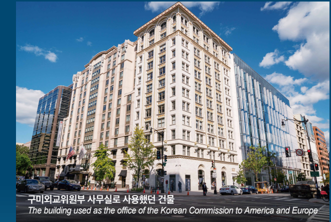
구미외교위원회 사무실로 사용했던 건물 The building used as the office of the Korean Commission to America and Europe

이곳은 1919년 대한민국 임시정부가 미국과 유럽을 대상으로 독립 외교를 전개하기 위해 설치한 대미 외교 거점이다. 구미외교위원회는 미국 사회와 정계를 대상으로 일제 식민 통치의 실상을 폭로하고, 한국 독립을 지지하는 국제 여론을 조성하기 위해 선전과 외교 활동을 펼쳤다. 초대 위원장 김규식을 비롯해 현순, 서재필 등이 위원장직을 수행하였으나, 워싱턴 군축회의(1921.11~1922.2) 이후 활동이 점차 축소되었다. 이후 조직 개편과 재정난 등으로 위축되었던 활동은 훗날 주미외교위원부로 계승되어 대한민국 대미 외교의 기틀이 되었다. 당시 위원부가 사용했던 건물은 이후 'Peoples Life Insurance Building'을 거쳐 현재는 이웃 빌딩과 합쳐진 채 상업 공간으로 활용되고 있다.