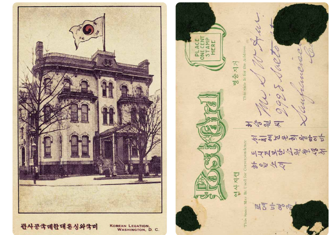
주미대한제국공사관 사진 엽서(1910년대) Postcard of the Old Korean Legation(1910s)

In 1910, the Korean Empire was stripped of its sovereignty by Japan, and the Legation building suffered the tragic fate of being seized. However, within the Korean-American community, the building emerged as a powerful symbol of independence. This was because Koreans regarded the Legation as a "representation of national rights that must be reclaimed" and a "testament to the restoration of sovereignty." During the colonial period, Korean immigrants in the U.S. produced postcards of the Legation featuring a large Taegeukgi (Korean flag) and exchanged them to strengthen their firm resolve for independence.